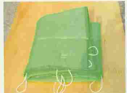
メッシュタイプ写真